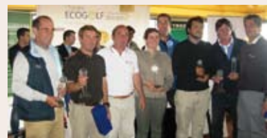
Grupo de premiados en el torneo