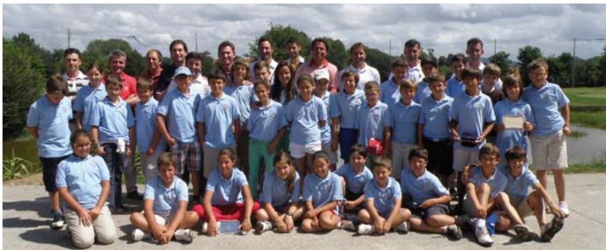
Pro-Am Jóvenes Promesas 2012

Durante estos últimos meses se han celebrado ocho campeonatos de Galicia de las diferentes categorías. Comenzamos a principios de mayo con el Campeonato de Galicia Mayores de 35 años , celebrado en el R.C.G. La Coruña, para el que se inscribieron más de 200 jugadores/as. Finalmente pudieron participar 144 siendo los vencedores M a