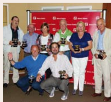
Grupo de Premiados

La Copa de Oro es una de las competiciones amateur más antiguas y de mayor prestigio que se disputan en España y ha conformado, casi desde sus inicios, una parte fundamental de la imagen del club, gracias al copatrocinio de la Fundación Pedro Barrié de la Maza.