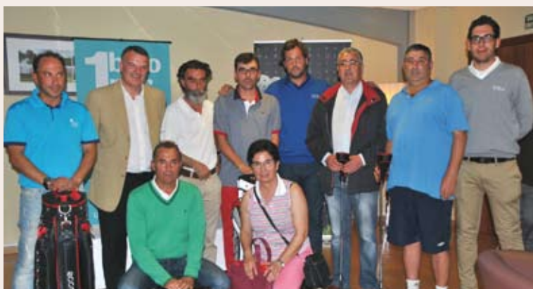
Ganadores del II Open Ribeira Sacra

La prueba que se disputaba bajo la modalidad individual stableford hándicap con dos categorías de juego estuvo dominada en la categoría scratch por