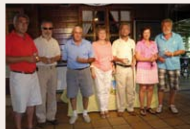
Grupo de ganadores