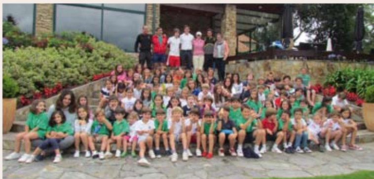
Grupo de niños y monitores

Este año, ha habido la mayor participación de la historia del club con más de 300 niños con edades comprendidas entre los 5 y 14 años.