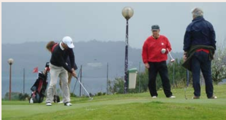
Jugadores durante el torneo

Durante los días 25, 26 y 27 de Mayo se celebró en el Campo Municipal de Golf Torre de Hércules la II edición del Torneo Primavera de Pitch & Putt con la participación de 100 jugadores que consiguieron unos magníficos resultados.