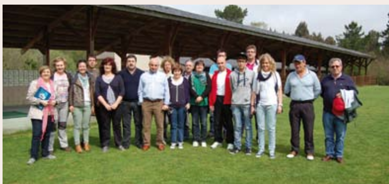
Escuela Municipal de Golf Balneario de Guitiriz

El 14 de mayo de 2012 responsables de los ayuntamientos de Guitiriz y Begonte, en Lugo, firmaron un convenio con el Club de Golf Balneario de Guitiriz, perteneciente al Resort Hotel Balneario y Club de Golf Balneario de Guitiriz, para la creación de la Escuela Municipal de Golf.