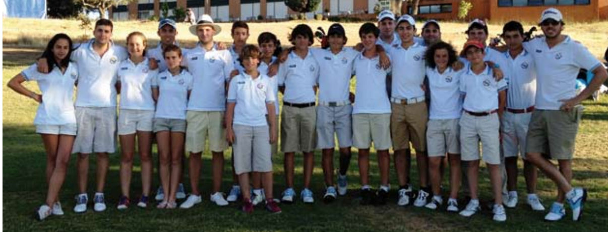
Equipo Gallego Match Federaciones del Noroeste 2012