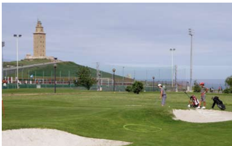
C.M.G.Torre de Hércules

No se puede asegurar que un handicap puro para el Pitch & Putt, sea más eficaz que el utilizado según el sistema EGA de valoración de campos, es cuestión de utilizarlo. Lo que no podemos es criticar este sistema por algunos resultados “escandalosos”, que son la excepción. El reciente estudio realizado por el comité técnico de campos y handicap de la RFEG, elaborado en base a cientos de miles de resultados, demuestra que el handicap oficial de golf es totalmente viable tanto para jugar al golf, como para la especialidad de Pitch & Putt.