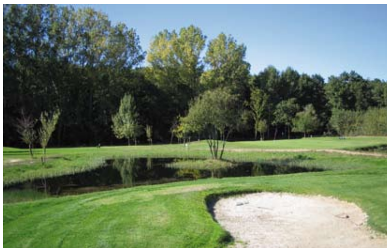
C.G. Río Cabe

durante el primer semestre, un total de 42 pruebas para el ranking nacional, de donde salen los jugadores que representan a España en las distintas confrontaciones Internacionales. En el plano internacional, destacar los primeros matches de Pitch and Putt a nivel federativo celebrados en Europa contra Francia y Portugal, con sendas victorias de España.