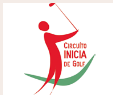
Logo Circuito Inicia de Golf

Para más información pueden entrar en la web del circuito www.circuito-iniciadegolf.com