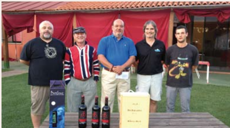
Gandores del Torneo Grelo

El pasado 21 y 22 de Julio se ha celebrado en el campo del Club de Golf Río Cabe, en el magnífico recorrido de Pitch and Putt, el TORNEO "O GRELO".