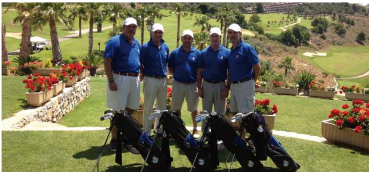
Equipo Gallego Interterritorial Pitch&Putt