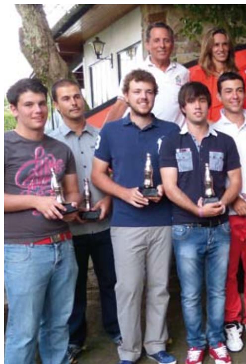
Grupo de Premiados