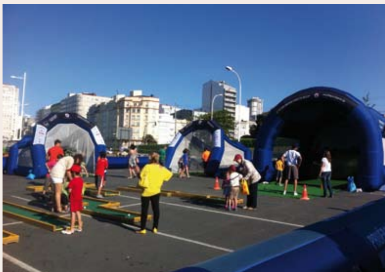
Campaña "Golf en la playa", en Riazor

folletos que fueron entregados a todos los que se acercaban a las instalaciones. Los clubes gallegos que se sumaron a esta iniciativa fueron: C.M.G. Torre de Hércules, C.G. Miño, C.P. Meis, C.G. Lugo, C.G. Campomar, Hércules C.G., R.A.C. Vigo, G.B. Mondariz, G.B. Augas Santas y Pitch&Putt Valga Golf.