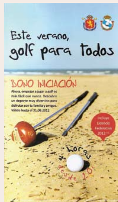
Folleto de la campaña "Golf en la playa"

Además, para reforzar esta campaña, varios clubes gallegos quisieron aportar su granito de arena presentando unos bonos para clases de golf de iniciación a unos precios muy asequibles. Estas ofertas se reflejaron en unos