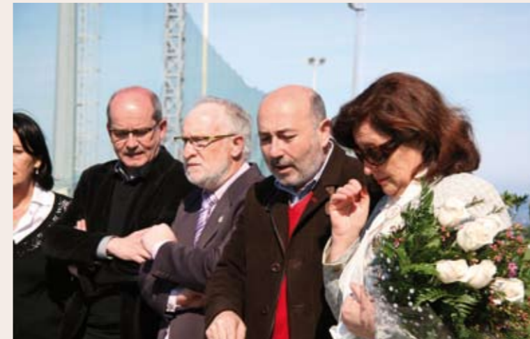
Concejal de Deportes, Presidente de la Peña J.A. Pan, Alcalde de A Coruña y viuda de J.A. Pan