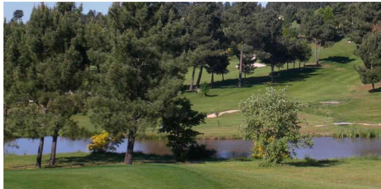
La Federación Gallega de Golf ha felicitado al Montealegre Club de Golf por la innovadora iniciativa

Se trata de introducir la práctica del golf en los colegios como parte de la asignatura de Educación Física