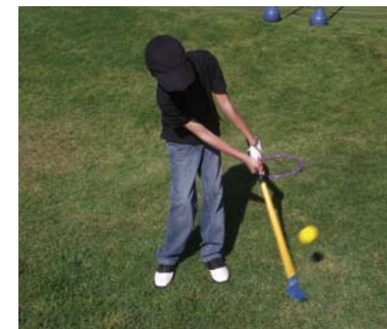
Este proyecto, pionero en Galicia, incluye en una primera fase a cinco colegios de la provincia de Ourense