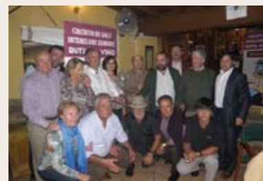
Golf Ría de Vigo, equipo ganador en la Ruta do Viño 2010

nior se celebró por primera vez en el año 2010 con la participación de siete clubes y unos 130 jugadores/as. El éxito de este innovador proyecto en Galicia, por el cual felicitamos a sus organizadores, ha hecho que la F.G.G. haya decidido apoyarlo y potenciarlo, en respuesta a la petición de los jugadores de categoría senior gallegos, que han encontrado así una forma de seguir compitiendo y entablando buenas relaciones con sus compañeros de categoría de otros clubes.