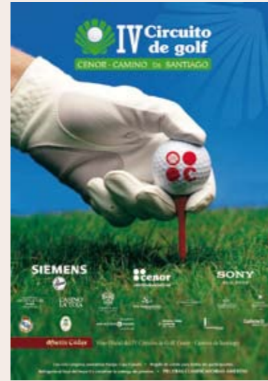
Cartel del Circuito Cenor-Camino de Santiago 2011

El Circuito Cenor-Camino de Santiago es el Circuito amateur por parejas más importante de Galicia y desde el año 2009 ha extendido su red a otras comunidades autónomas del norte de España como Navarra, País Vasco y Asturias.