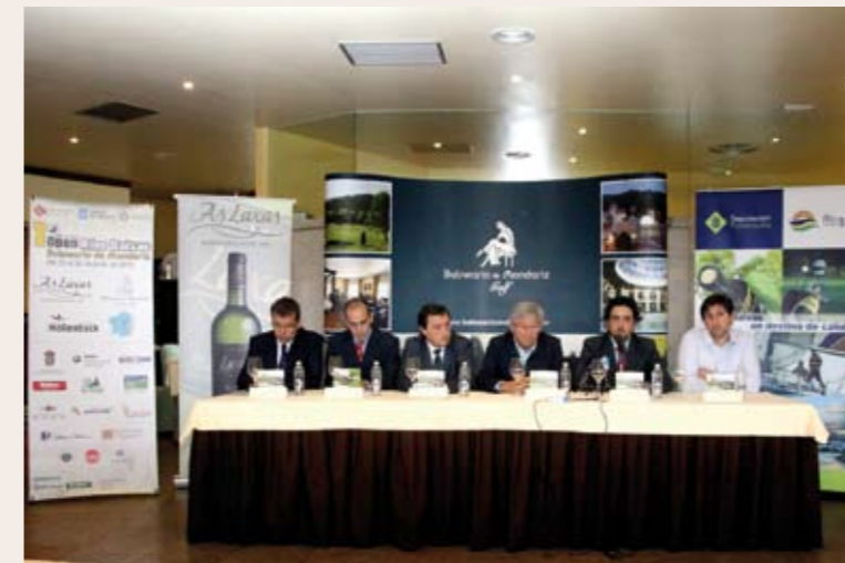
Presentación del Open Rías Baixas, en las instalaciones del Balneario de Mondariz

El proyecto sería imposible sin el apoyo incondicional de empresas e instituciones, especialmente de Turgalicia, Turismo Rías Baixas y Deputación de Pontevedra así como albariño As Laxas. El coste de este tipo de pruebas es muy alto y estas contribuciones hacen posible que Galicia vaya consolidándose como destino turístico de golf.