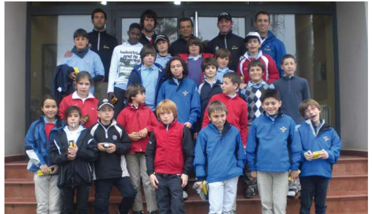
Clinic Jóvenes Promesas