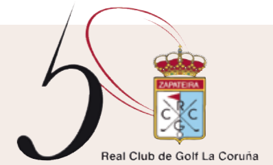
Imagen del 50 aniversario del RCGC

Desde aquel lejano 1961, en que un grupo de coruñeses encabezados por el Excmo. Sr. D. Pedro Barrié de la Maza, Conde de Fenosa, creara el primer campo de golf de 18 de hoyos de Galicia, el Real Club de Golf de La Coruña se ha constituido como una de las principales entidades sociales y deportivas de Galicia; así lo avalan sus 5.500 socios que lo han convertido en uno de los recorridos de golf más admirados de España.