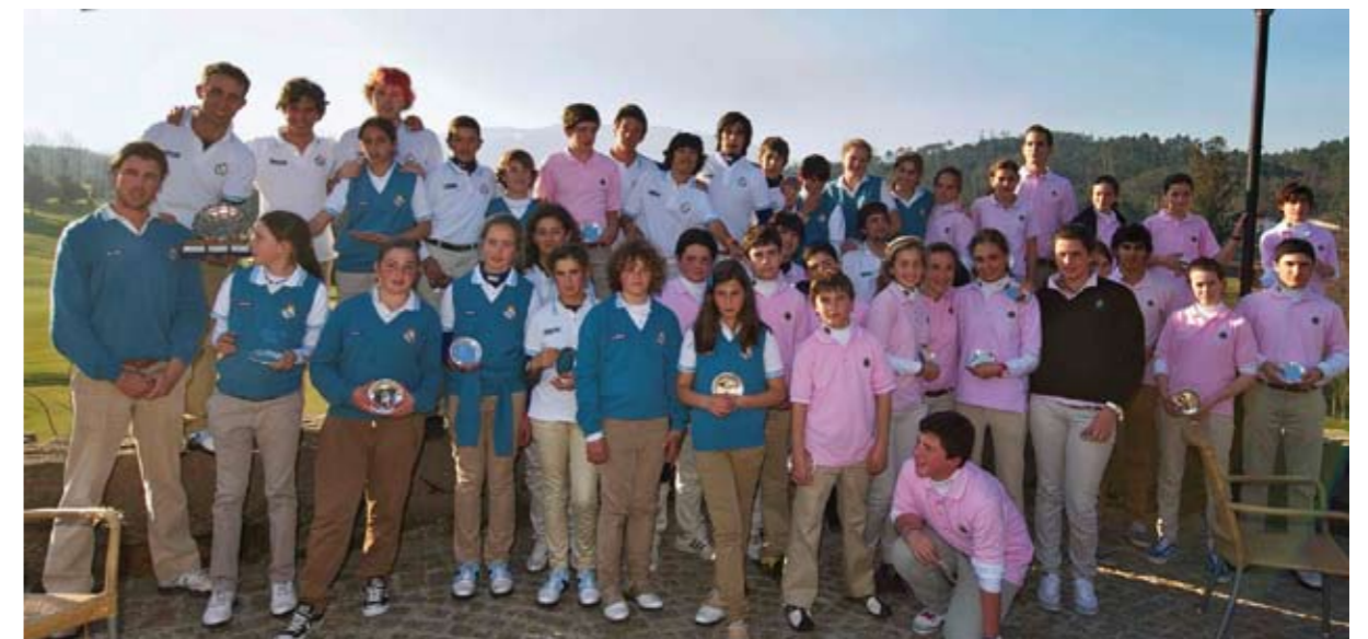
Desafío Juvenil, Equipos Gallego y Asturiano

A principios de febrero tuvo lugar la décima edición del Desafío Juvenil Galicia-Asturias en el Golf Balneario de Mondariz. El equipo gallego consiguió vencer por un