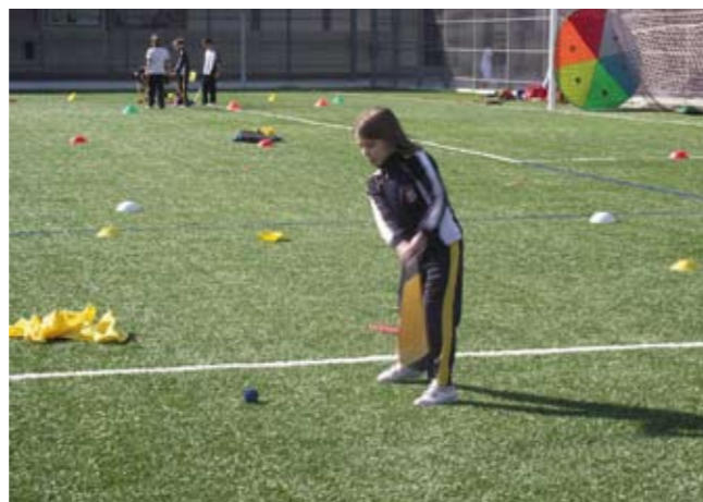
El material utilizado para estas clases ha sido aportado por la Real Federación Española de Golf

El material utilizado para estas clases ha sido aportado por la Real Federación Española de Golf y consiste en un kit para cada colegio basado en la