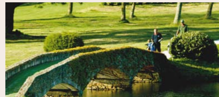
Campo del R.C.G. La Coruña

Con los antecedentes del éxito logrado en la primera edición y, una vez que se ha divulgado el torneo Torre de Hércules de Oro entre el mundo golfístico, para este año 2011 (en el que se celebra el 50 aniversario de la fundación del club), está prevista la consolidación del mismo y su conversión en uno de los torneos de referencia para los jugadores senior, tanto a nivel nacional como internacional.