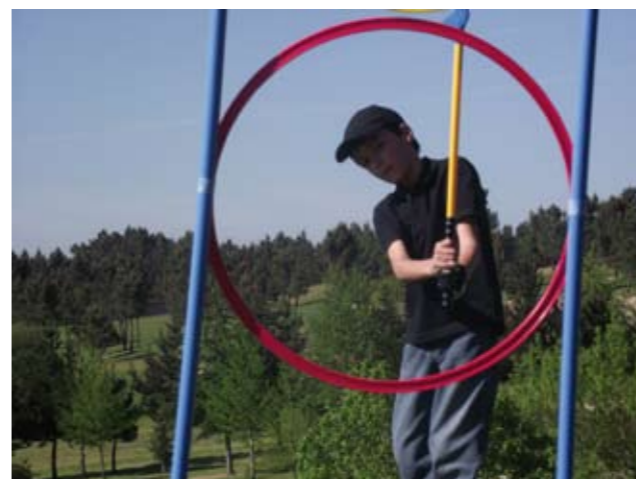
El colofón de este proyecto serán varios torneos de golf que se celebrarán en el mes de junio en el Montealegre Club de Golf

Los niños reciben instrucción sobre juego largo, juego corto, putt, normas de etiqueta e introducción a las reglas del golf