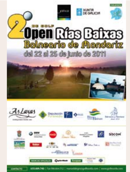
Cartel promocional del Open Rías Baixas

La experiencia hace pensar que este año se rozarán los 100 jugadores. Ya han confirmado muchos de la primera edición que han mostrado su intención de repetir, lo que augura poder lograr un buen posicionamiento en el calendario nacional de torneos de calidad.