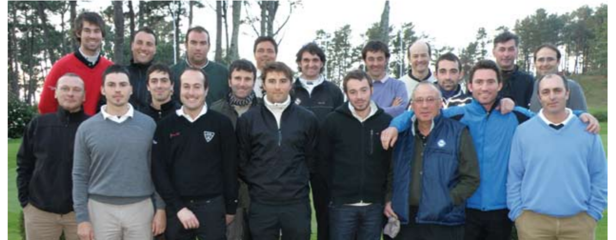
Grupo de profesionales en la 1ª prueba del circuito