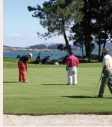
Golf La Toja

En cada prueba (que se celebra siempre en martes y con salidas a tiro) los clubes participantes presentan un equipo de 12 jugadores, que puede variar de jornada a jornada, siendo el equipo ganador el que más puntos reúna en la contienda de las 9 pruebas. Tras cada prueba, todos los jugadores son invitados a una comida en la que se degustan los caldos de las bodegas de vinos gallegos que patrocinan a los equipos. Además de las 9 pruebas, se disputa también una Final en la que se realiza la entrega de premios globales y que este año se celebrará el 13 de septiembre en el Golf Ría de Vigo. La Liga Se-