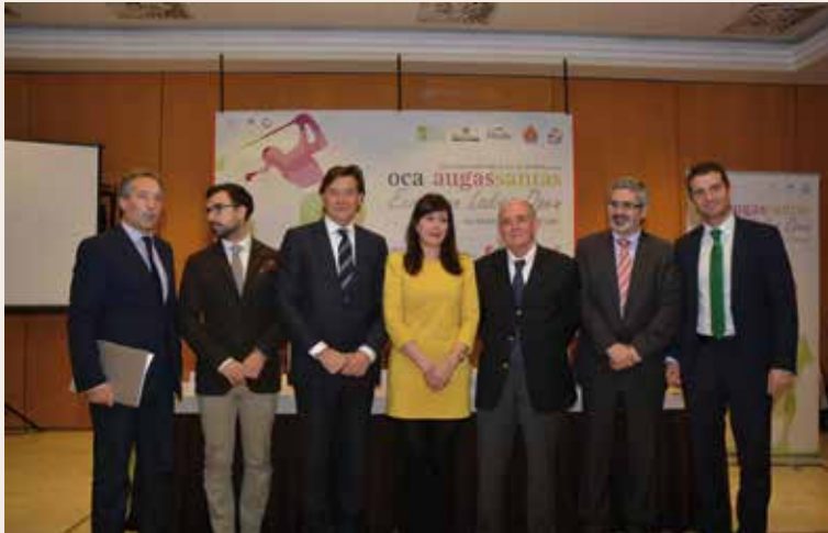
Resentación del VIII Golf Ladies Open Galicia 2014

El Oca Augas Santas European Ladies Open Galicia 2014 transcurrirá del 28 al 31 de mayo en Oca Augas Santas Balneario & Golf Resort. Se confirma la continuidad del torneo para los próximos tres años