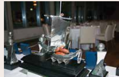
Trofeo Circuito Luso Galaico

buenos precios; lograr patrocinios de empresas locales; aumentar la participación en nuestros campos y avanzar en la amistad y buen hacer del golf gallego y portugués.