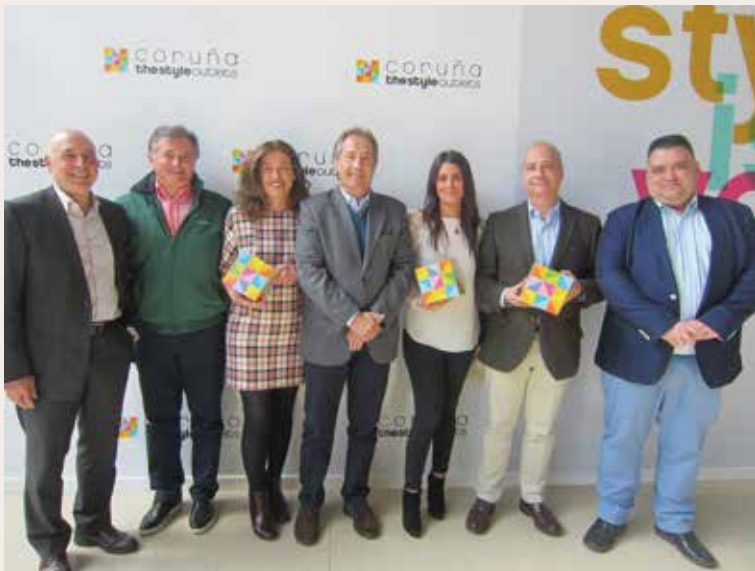
Presentación del II Circuito Coruña The Style Outlets de Golf

Las modalidades de juego y categorías son 18 hoyos individual stableford en cada prueba y se establecen 3 categorías: scratch, primera y segunda hándicap. El límite entre la primera y segunda categoría hándicap se determina en función de los hándicaps de los jugadores inscritos. La inscripción se realiza en los clubes que participan en el circuito.