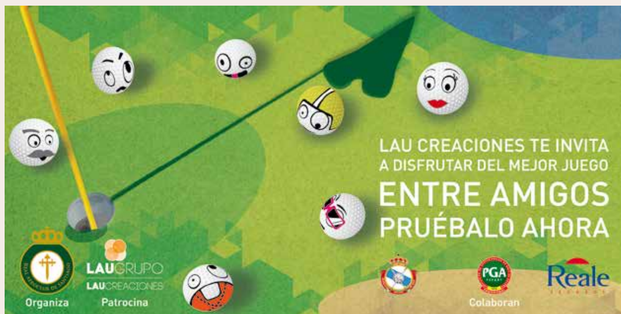
Campaña de promoción del R.A.C. Santiago

El R.A.C. Santiago dispone para esta actividad de unas nuevas y magníficas instalaciones deportivas en Ames, con la sección de golf operativa y el resto (piscinas, padel, tenis, infantil...) que se estrenarán este verano.