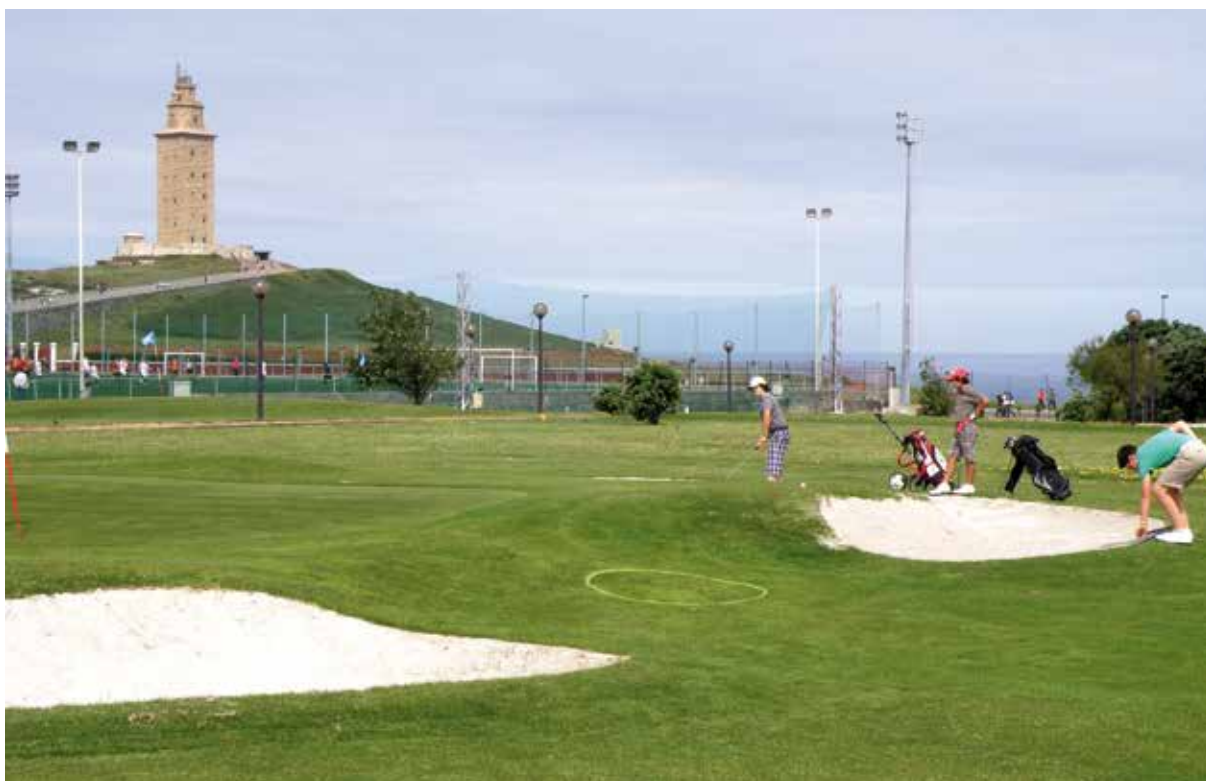
C.M.G. Torre de Hércules