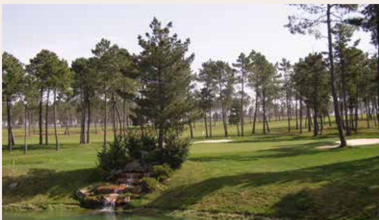
Campo de Golf de Meis

El Campo de Golf de Meis abrió de forma excepcional una campaña de captación de nuevos abonados. Hasta el 31 de enero todas las personas interesadas en iniciarse en el apasionante mundo del golf, tuvieron una oportunidad única en la Fundación Monte-Castrove.