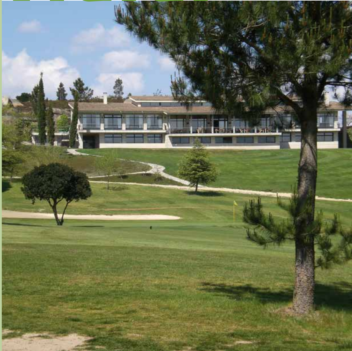
Montealegre Club de Golf