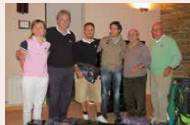
Ganadores de la Liga de Equipos

Como en anteriores ocasiones, se hizo un sorteo de regalos entre los participantes. La empresa Castañer y Castañer cedió algunos de estos regalos para el sorteo.