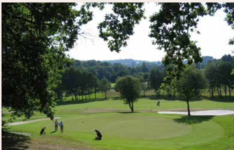
Club de Golfo Lugo