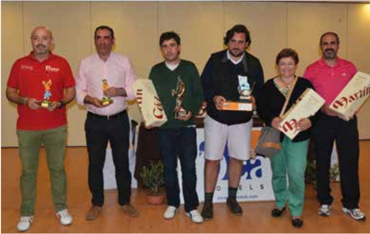
Ganadores del Torneo Semana Santa