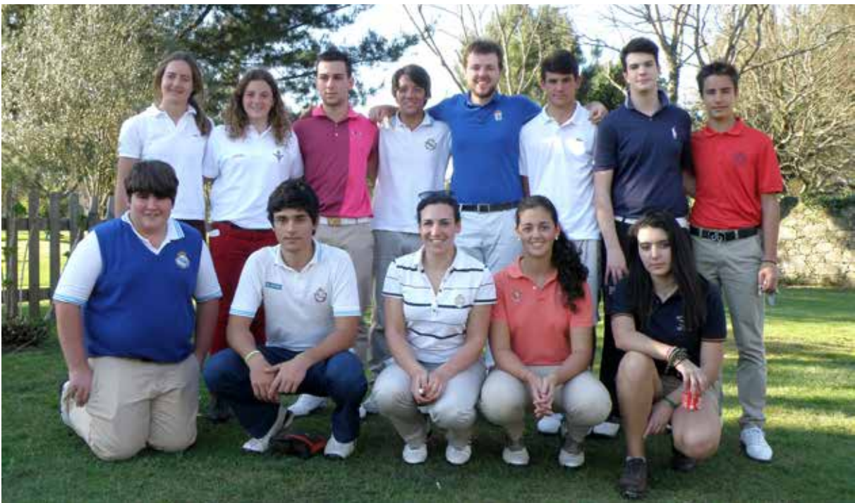
Participantes de la 1ª Prueba de Ranking Gallego Sub-25

Tecnificación: Se han celebrado diversos clínicos durante este principio de año para los jugadores de los siguientes grupos: seguimiento cadete y sub-18, transición y jó-