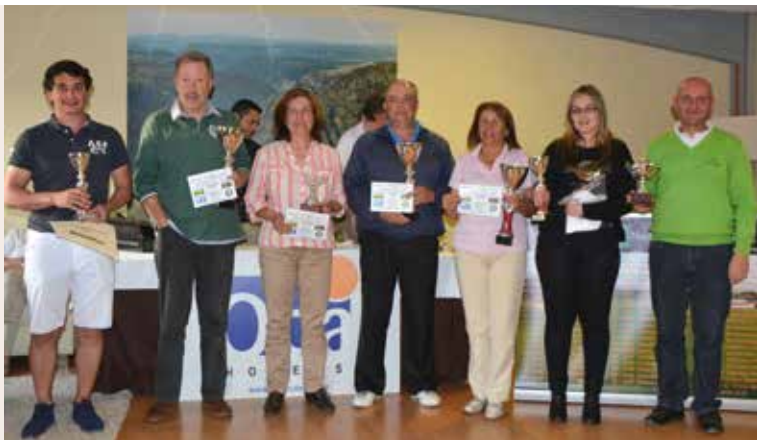
Ganadores del Match Quality Golf 2014