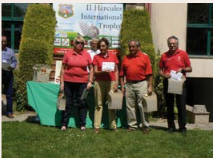
El equipo campeón Scratch fue THE PLAYERS

En mayo se disputaba la segunda jornada de este torneo por equipos. Después de la gran igualdad mostrada por los equipos en la primera jornada, todos los participantes sacaron sus mejores golpes para conseguir un buen resultado y llevarse a casa la victoria. Muestra de ello fueron los grandes resultados obtenidos.