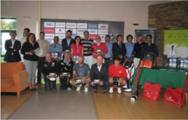
Grupo de premiados