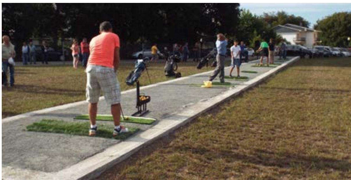
Jugadores practicando el día de la inauguración de la cancha