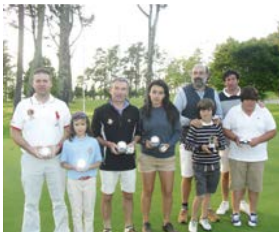
Premiados del Campeonato de Padres e Hijos 2014