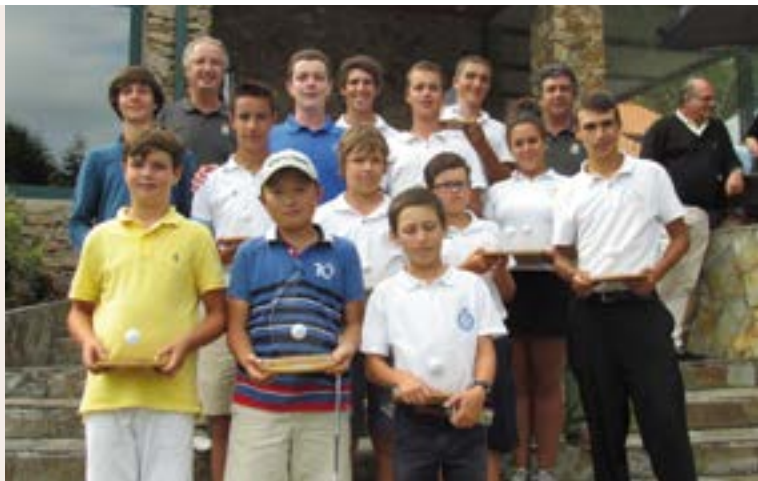
Ganadores de las distintas categorías