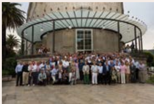
Jugadores de trece comunidades autónomas participaron en esta edición del Open