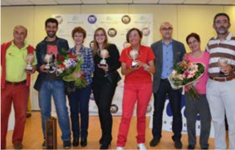
Ganadores VI Torneo Feira do Viño