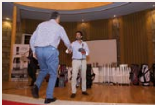
Un momento de la entrega de trofeos a los ganadores