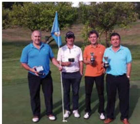
Premiados en el Campeonato Individual de Galicia de Pitch&Putt