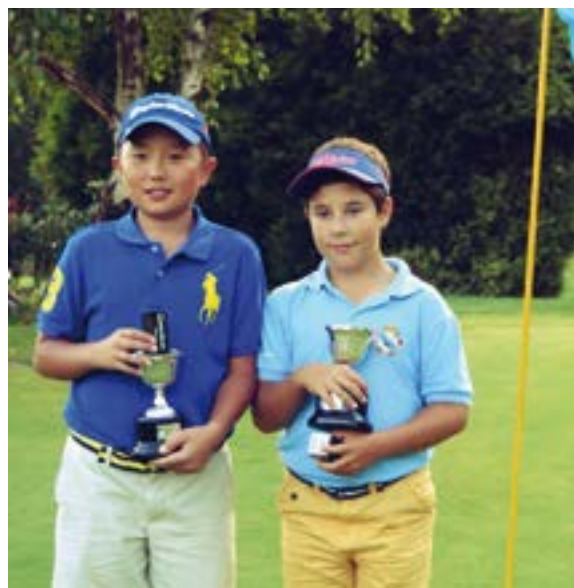
Campeones Dobles de Galicia de Pitch&Putt