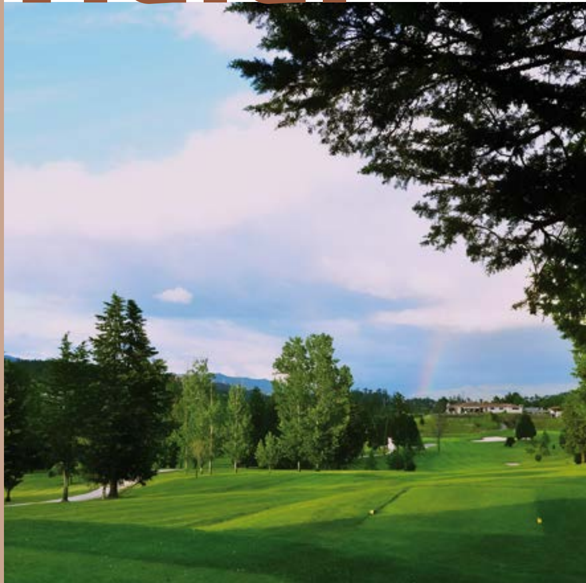
Golf Balneario de Mondariz

Calendario de clubes, campeonatos y pruebas federativas