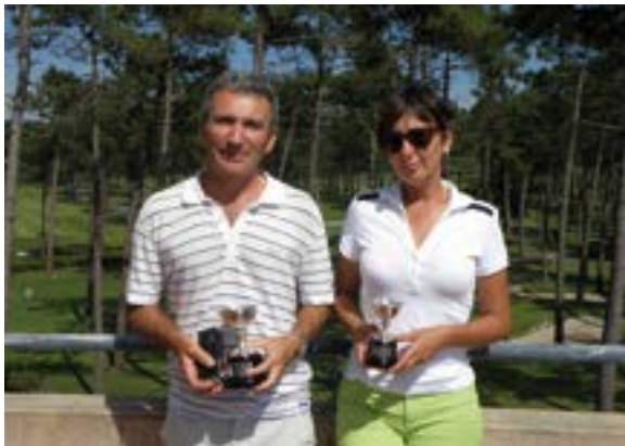
Campeones del Campeonato de Galicia Mayores de 35 años