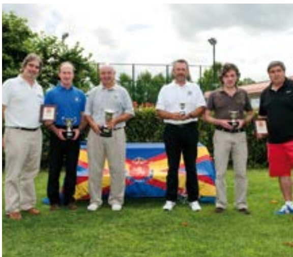
Premiados en el Campeonato de España Mayores de 35 de Pitch&Putt