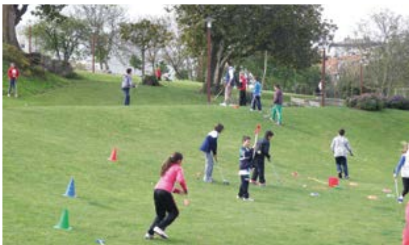
Desde la Federación se destina un presupuesto anual para promover el golf entre los más pequeños