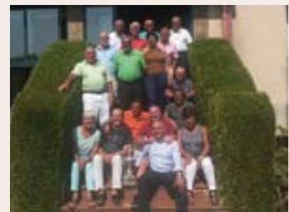
Equipo ganador C.G. Miño

Al terminar las partidas se procedió a la tradicional comida y a la entrega de premios a los ganadores.