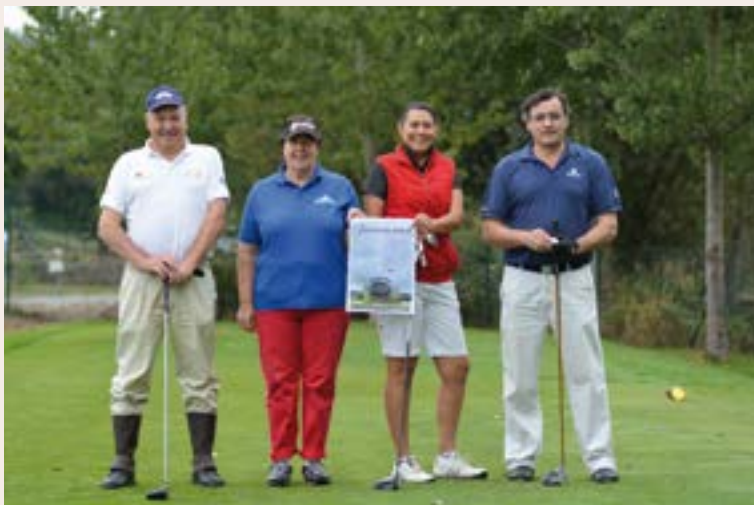
Grupo de participantes del Torneo de Golf Joyería Camilo

El 23 de agosto, en el campo de golf de Augas Santas, se disputó la XXI edición del torneo de Golf Joyería Camilo.