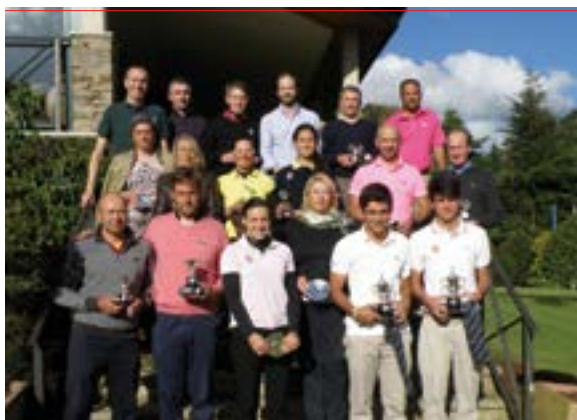
Premiados del Campeonato de Dobles de Galicia Absoluto