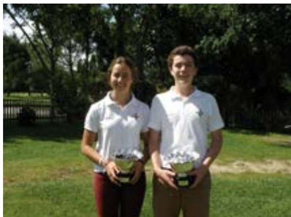
Campeones Campeonato de Parejas Mixtas