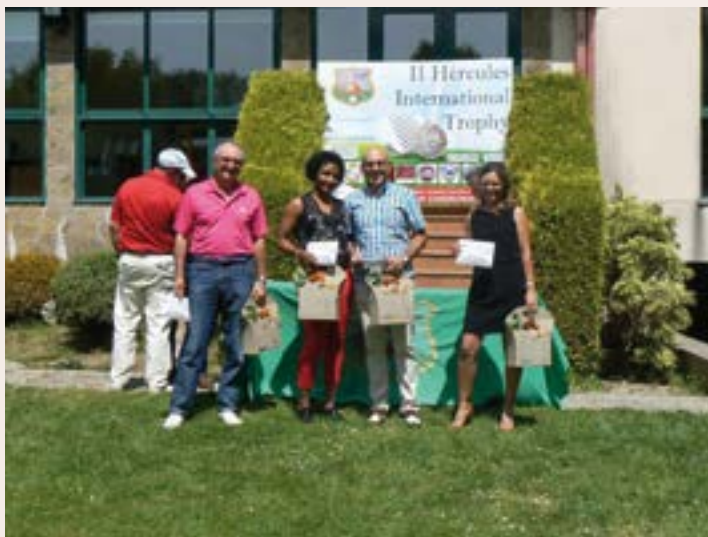
El equipo campeón Handicap fue IBERIA