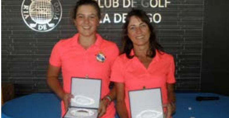
Campeonas Cto. Dobles Femenino

Ya en el mes de octubre se disputó el Match F.G.G. Norte vs Sur en el Golf Ría de Vigo. Se enfrentaron los equipos de mayores de 19 años de Galicia-Norte (jugadores/as de A Coruña y Lugo) y Galicia-Sur (jugadores/as de Ourense y Pontevedra), venciendo el equipo Galicia-Norte por un ajustado 11 a 10.