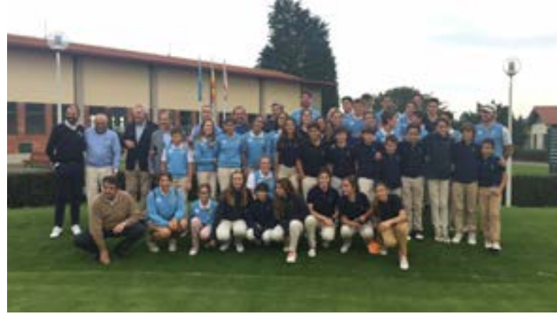
Desafío Juvenil Asturias-Galicia

También incluido en el Programa de Tecnificación como un Match de entrenamiento, se celebró a finales de octubre el Desafío Juvenil Asturias-Galicia en el C.M.G. La Lloreia (Asturias). En esta competición se enfrentaron los equipos juveniles de ambas comunidades formados por 10 niños y 10 niñas cada uno. En esta ocasión, y tras varios años en los que no se había podido celebrar, venció con contundencia el equipo gallego por 16 a 24 puntos.