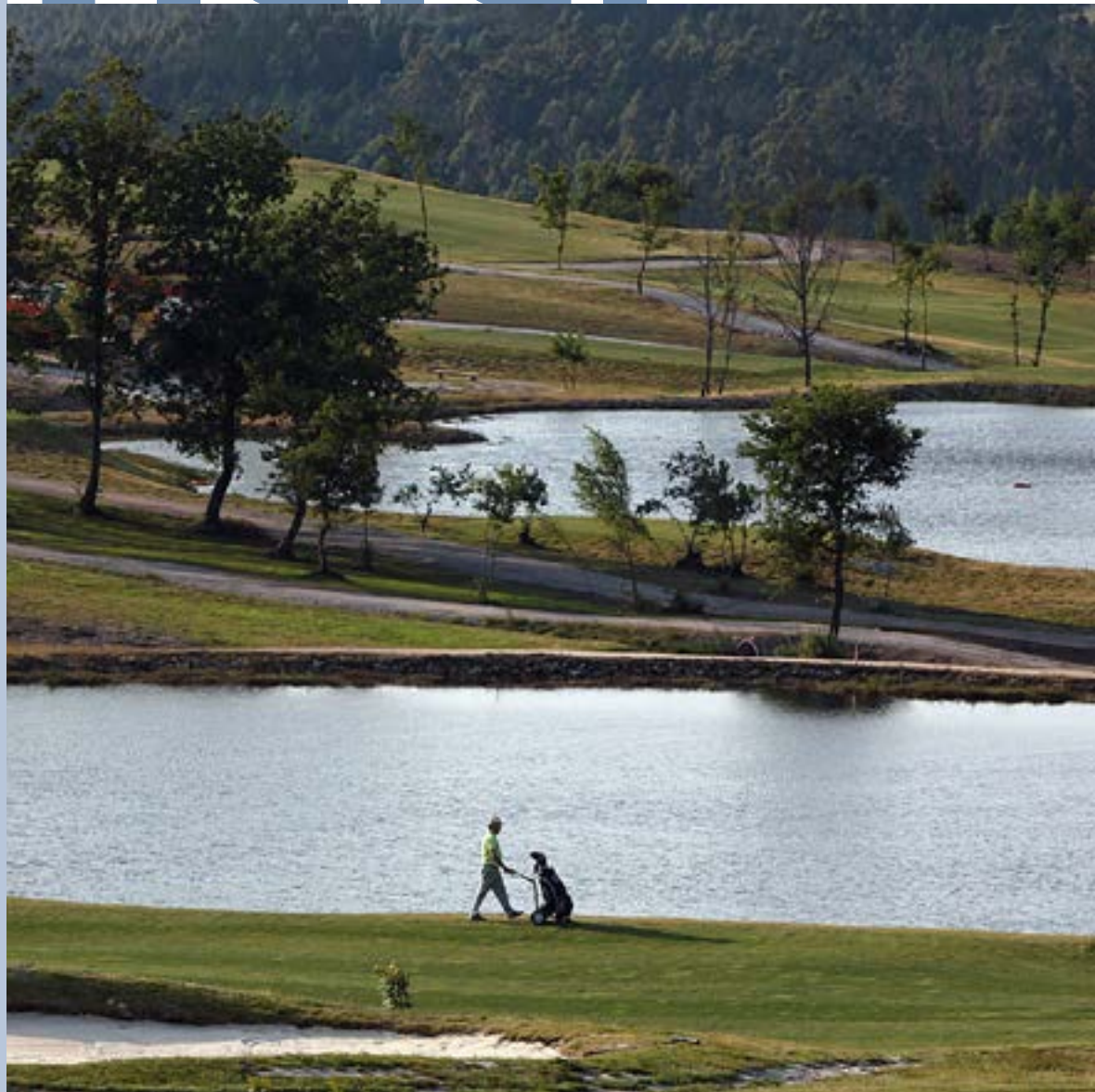
Real Aero Club de Santiago

Calendario de clubes, campeonatos y pruebas federativas