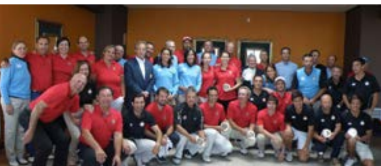
Equipos Match Castilla y León-Galicia